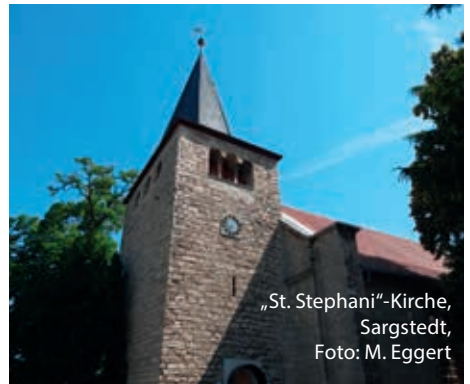
„St. Stephani“-Kirche, Sargstedt